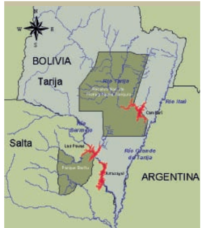
Mapa localización de las presas de la Alta Cuenca del Río Bermejo

El Tratado de Orán requirió de una reglamentación que fijara los lineamientos generales sobre la labor de la comisión y configurara un acuerdo que sirviera de marco para las acciones. Dicha regla-