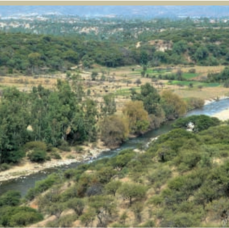
Valle Central de Tarija - Bolivia

el Medio Ambiente (PNUMA) y el nuevo Fondo para el Medio Ambiente Mundial (FMAM-GEF), con el objeto de identificar la posibilidad de llevar adelante la preparación de un Programa Estratégico de Acción para la Cuenca Binacional del Río Bermejo. Para ello se realizó una serie de misiones y contactos de trabajo entre las partes involucradas en la iniciativa. En septiembre de 1995, la Comisión Binacional concretó una solicitud de asistencia del FMAM-GEF para su preparación, con el objetivo de resolver los principales problemas ambientales transfronterizos y promover el desarrollo sostenible en la Cuenca Binacional.