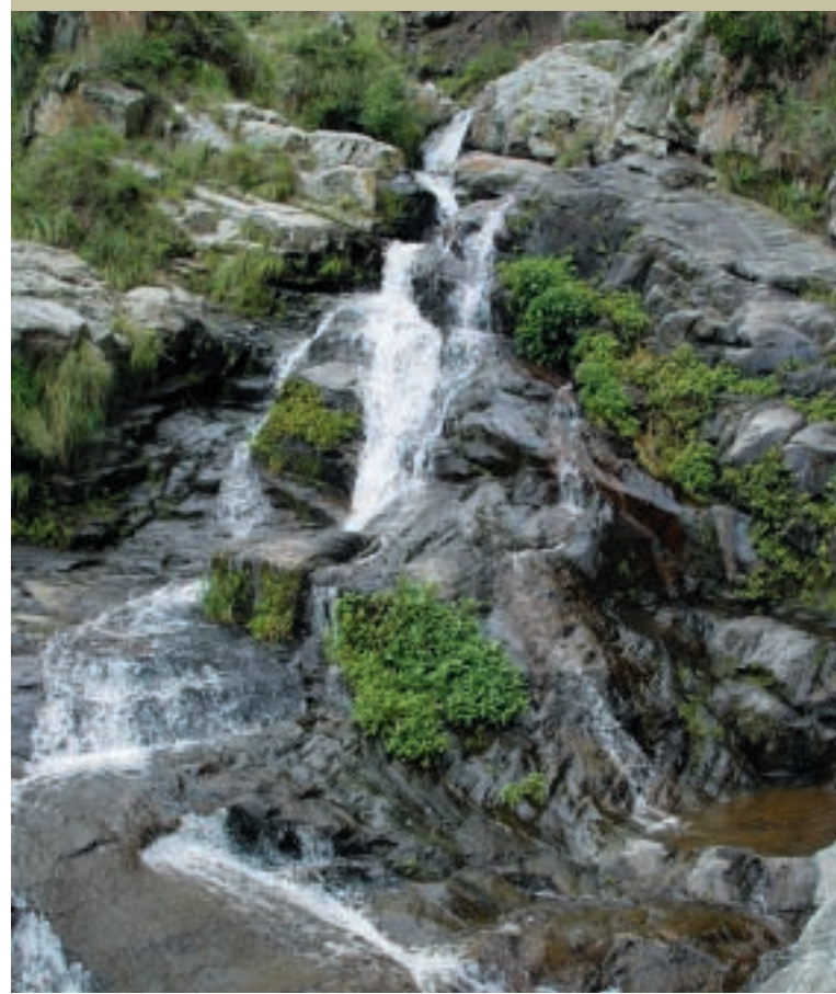
Coimata – Tarija – Bolivia

En un escenario diferente, caracterizado por la