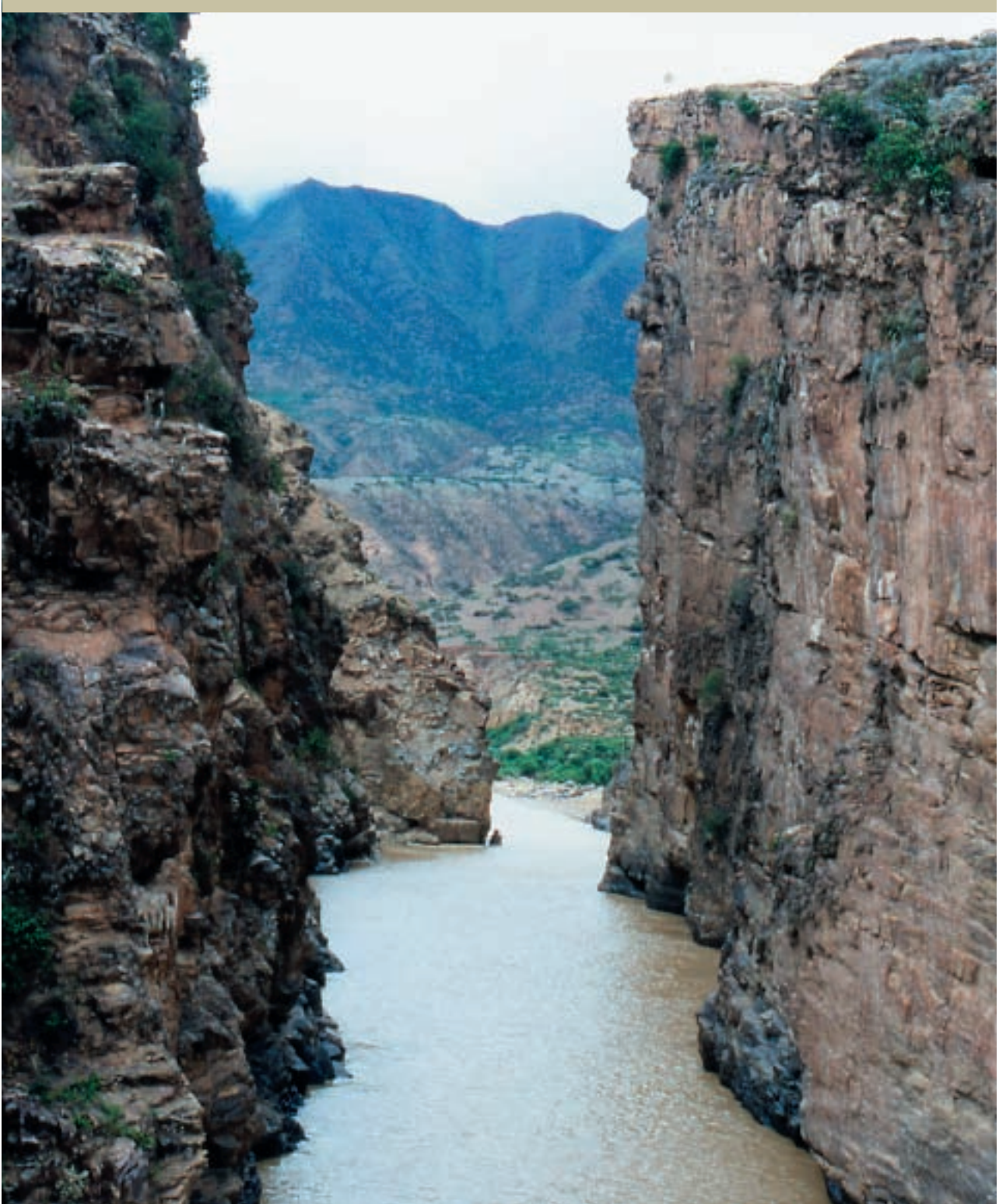
Río Tarija - La Angostura, Tarija, Bolivia