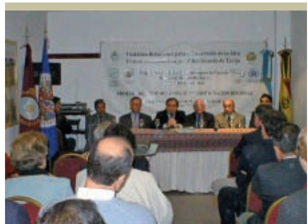
Comité de Coordinación Regional 1ª Reunión, Ciudad de Orán – Pcia. de Salta - Argentina