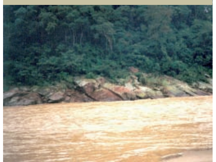
Río Bermejo - Alta Cuenca

Actualmente, la COBINABE mantiene el objetivo inicial de obtener financiamiento para ejecutar las obras de regulación y aprovechamiento hidráulico, pero con una orientación más clara hacia el “uso múltiple” de las aguas, que redunde en beneficios sociales para las comunidades locales con atención a los aspectos ambientales involucrados.