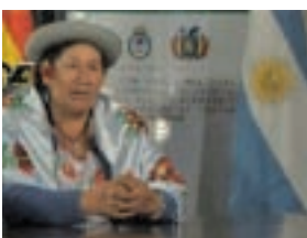
Comité Binacional de Coordinación – CBC 1º Encuentro en Palpalá Pcia. de Jujuy - Argentina

En este sentido, la COBINABE trabaja en la coordinación de proyectos y acciones de cooperación entre Bolivia y la Argentina para alcanzar el desarrollo sostenible en la cuenca. Para hacerlo posible, impulsa e implementa mecanismos de participación ciudadana a través de la coordinación de