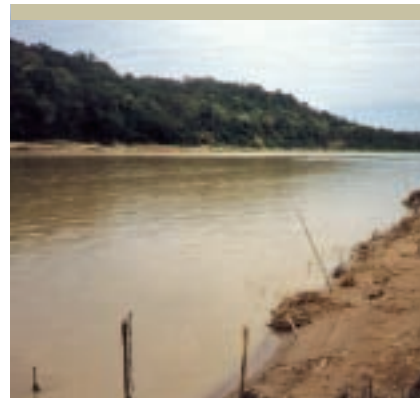
Alta Cuenca y Baja Cuenca del Río Bermejo

El proceso previsto para la ejecución del PEA de Corto Plazo, que originalmente fue de cinco años (2001-2006), debió ser reprogramado sucesivamente a fin de acompañar los avances en las políticas de gestión de los recursos hídricos y el desarrollo sostenible en ambos países.